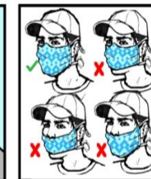
Use la mascarilla correctamente. Wear mask properly.