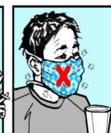
No se ponga máscara usada. Don't use mask again.