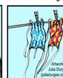
Séquelas con el sol. Hang masks to dry in sun.