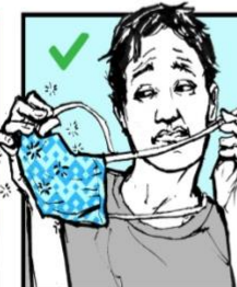
Quítese la máscara desamarrando lazos. Remove mask with ties.