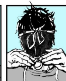
Amarre los lazos firmemente, antes de.....poner la gorra. Tie ties firmly before.....putting hat on.