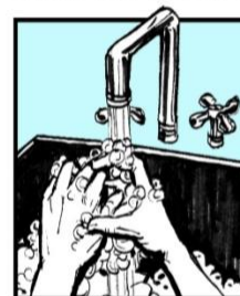
Lávese las manos. Wash your hands.