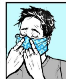
Presione su nariz para ajustar la máscara. Press nose wire to fit.