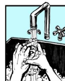
Lávese las manos otra vez. Wash hands, again.