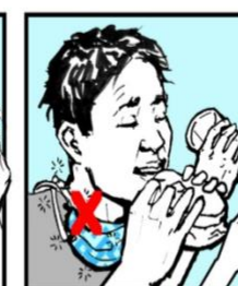
Quítese la máscara para comer o beber. Remove mask to eat, drink or smoke.