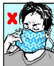
No toque la máscara. Do not touch mask.