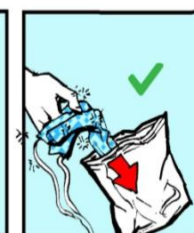
Ponga la máscara usada en una bolsa. Put used mask in bag.