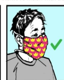
Use mascarilla limpia. Put on clean mask.